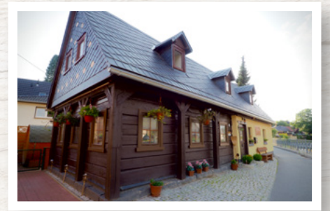
Ferienhaus Sissi Ferienhaus für bis zu 5 Gäste nur 2 km entfernt