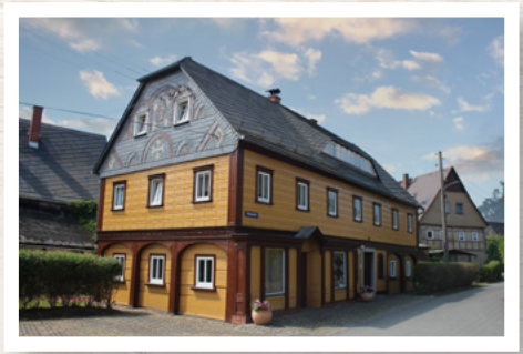
Ferienhaus Selma 3 Ferienwohnungen für bis zu 12 Gäste nur 200 m entfernt

Sie möchten mit mehr als 13 Personen anreisen? Wir haben weitere Objekte in unmittelbarer Umgebung zur Verfügung, in denen weitere Gäste untergebracht werden können: